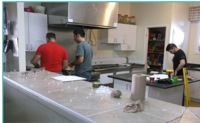
Travaux de rénovation de notre cuisine, été 2015