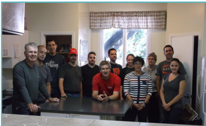
Rénovation de la cuisine

Merci à l'équipe de bénévoles d'Intact Assurances pour leur professionnalisme, leur efficacité et la qualité des travaux!