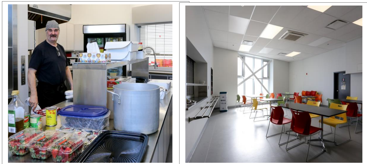
Cuisine et salle à manger

454 personnes sont venues utiliser les ordinateurs, dont 206 pour faire des démarches d'emploi.