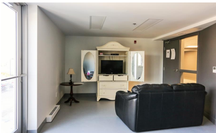
Un de nos nouveaux lieux d'accueil.