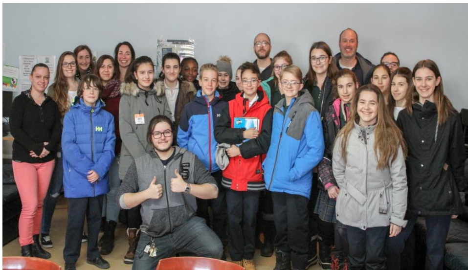
Jeunes de l'école Notre-Dame de Lourdes, en compagnie des intervenants de l'Abri

Nous recevons ces jeunes étudiants curieux et sensibles lors d'un midi. Nous prenons le temps de leur faire visiter la ressource et nous répondons à toutes leurs questions.